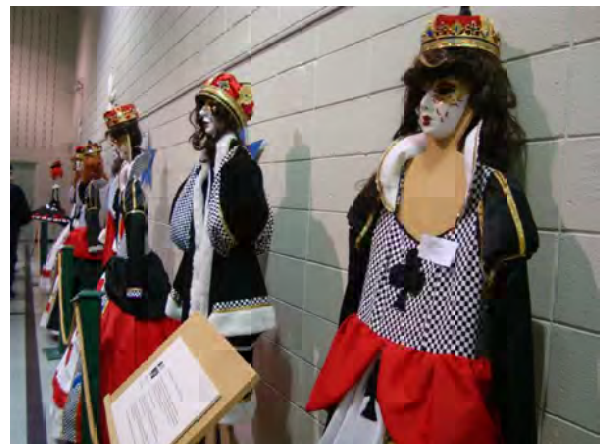
Quelques costumes que les gens portent lors des fêtes de la mi-carême