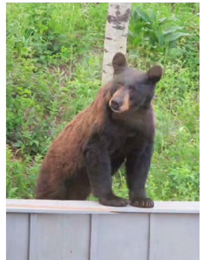
A bear who is curious and not too much nervous ... / Un ours curieux et pas trop nerveux...