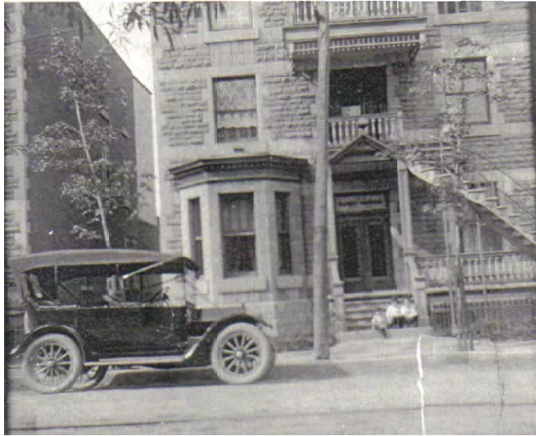
Le 590, rue Lasalle est la maison où la famille de Clément Robitaille a vécu de nombreuses années

Le député Robitaille fut toujours réélu avec des majorités importantes de 25 000 voix jusqu'à son décès en 1932 à l'âge de 58 ans.