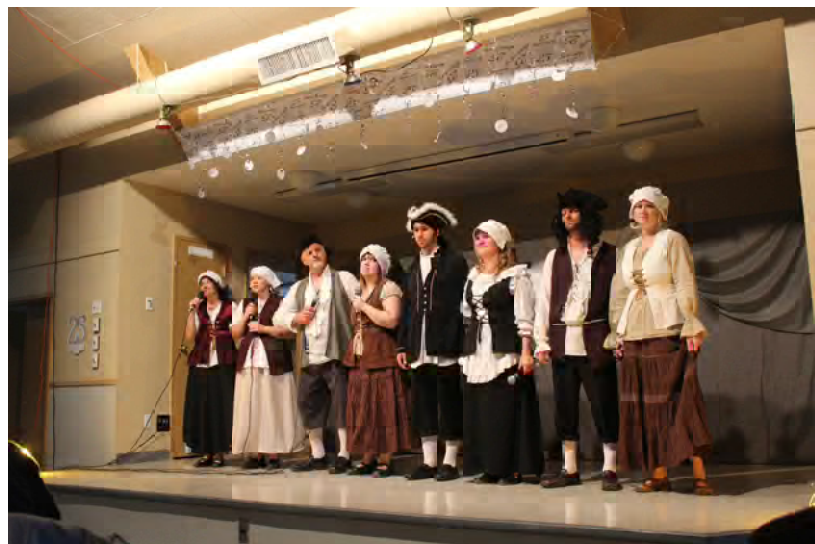
Les huit acteurs et actrices de la pièce qui, pour plusieurs, devaient jouer plusieurs rôles

C'est en distribuant des félicitations ici et là que toutes et tous quittèrent Saint-Gilles pour reprendre la direction de la Vieille Capitale, satisfaits et heureux d'avoir passé une agréable journée.