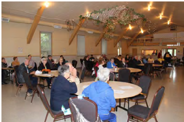
Une partie de l'assemblée dans la salle municipale de Saint-Gilles de Lotbinière