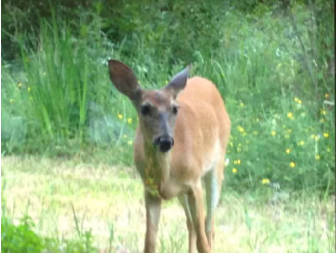
A deer who comes for a walk when bears and mountain lions have gone... / Un chevreuil qui se promène quand les ours et les lions de montagne sont partis...