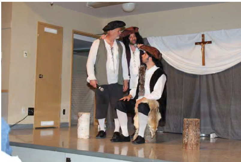
Trois jeunes hommes qui aiguisent leur stratégie pour convaincre les jeunes filles de devenir leur femme