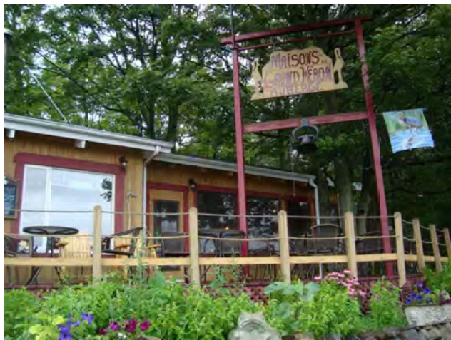
L'auberge du Grand Héron où s'était rassemblé le groupe pour fraterniser lors du dîner