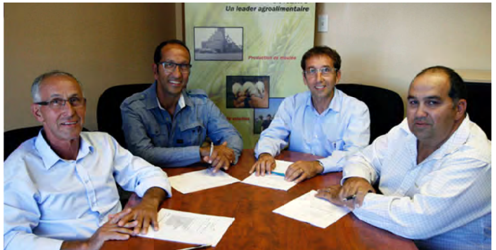
Le Conseil d'administration en session de travail

La tragédie au Lac-Mégantic affecte l'organisation car la direction a déclaré que la privation du transport ferroviaire lui ferait perdre des centaines de milliers de dollars.