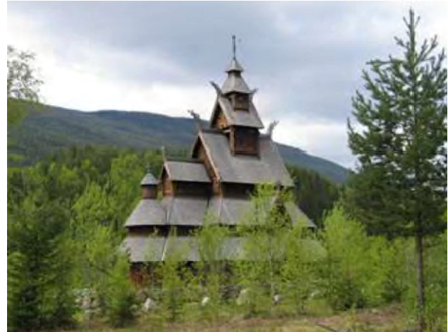
Une église en bois debout