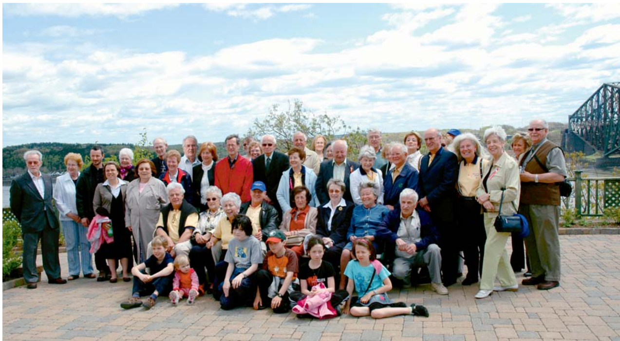
Groupe de participants à la rencontre à l'Aquarium.