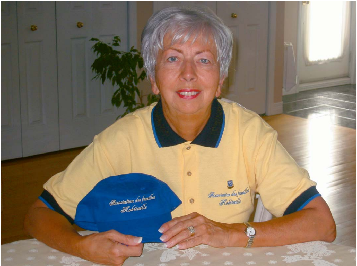
Notre présidente arbore fièrement les nouveaux items promotionnels de l'Association: la casquette et le polo.