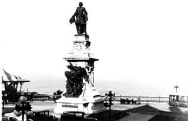
Monument Samuel - de - Champlain (négatif), [ca 1920-1930].

Le 21 septembre 1998 a marqué le centième anniversaire de l'inauguration du monument Champlain situé au début de la terrasse Dufferin autrefois appelée terrasse Frontenac. C'est la Société Saint-Jean-Baptiste de Québec (SSJBQ) qui avait été l'initiatrice de cette réalisation en 1898, cinq ans après la construction du Château Frontenac situé tout près.