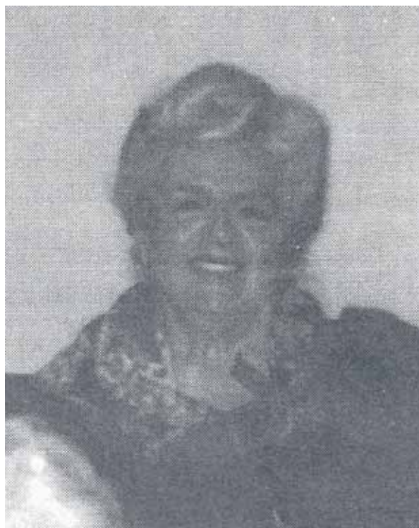
Lady Alys Robi