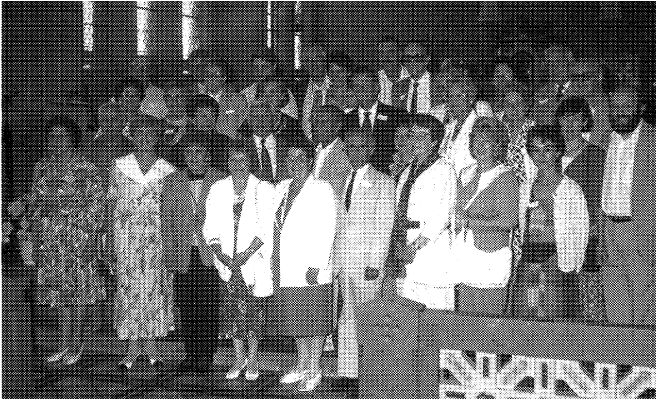
Cette photo prise par l'abbé Gérard Robitaille montre le groupe de voyageurs québécois en compagnie de leurs cousins français dans l'église St-Amand à Bailleul.