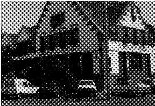
Auberge de la Forêt où a eu lieu la réception à La-Motte-au-Bois. C'est l'endroit des retrouvailles des descendants des deux côtés de l'Atlantique.

Après Bruxelles, Gand et Bruges, nous arrivons, dès le troisième jour du voyage à Bailleul, pour rencontrer nos cousins français. C'est par un beau matin ensoleillé que nous nous rendons à La-Motte-au-Bois, un petit village situé à dix kilomètres de Bailleul, où nous attendaient, à l' Auberge de la Forêt , une cinquantaine de Français, des Robitaille, des Robitaillie, des Robitaillé.